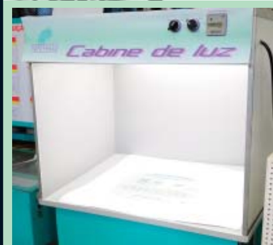
Ao lado, cabine de Luz para conferência de cores