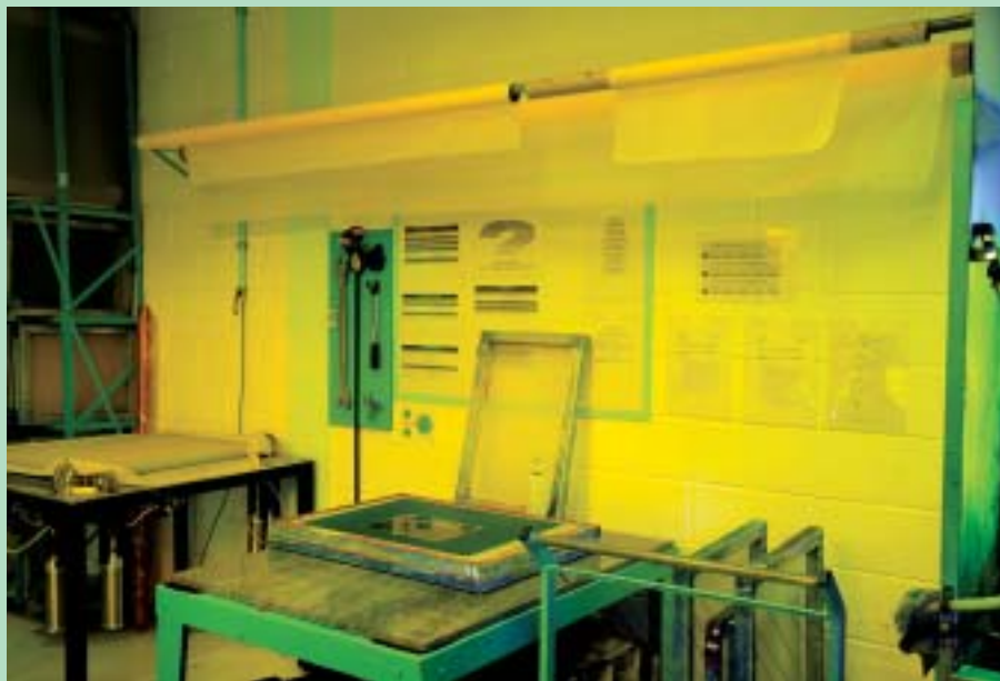
Painel produzido em serigrafia com 23 cores